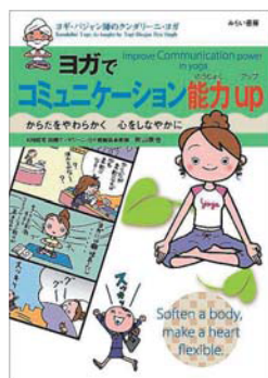
『ヨガでコミュニケーション能力up』 定価 本体1500円+税